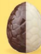
Praliné avec éclats de noisettes