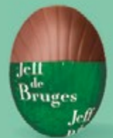
Praliné et éclats de crêpe dentelle