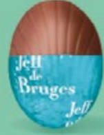
Ganache chocolat noir Équateur