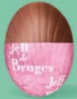
Praliné noisettes façon pâte à tartiner