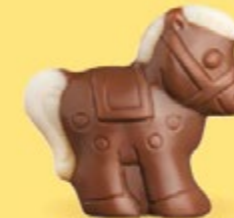
Praliné croustillant aux éclats de crêpe dentelle