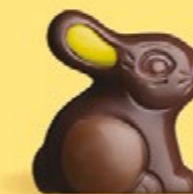
Praliné et éclats d'amandes caramélisées