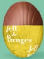
Praliné et éclats d'amandes caramélisées et salées