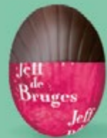
Praliné et éclats de noisettes caramélisées