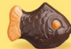
Praliné croustillant aux éclats de crêpe dentelle