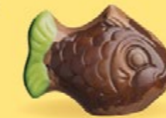
Praliné et noix de coco caramélisée