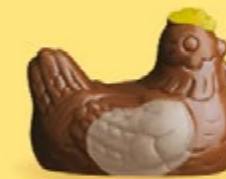
Duo praliné et ganache caramel