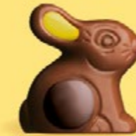
Praliné et riz soufflé