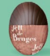
Praliné et noix de coco caramélisée