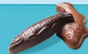
Chocolat au lait 36% de cacao