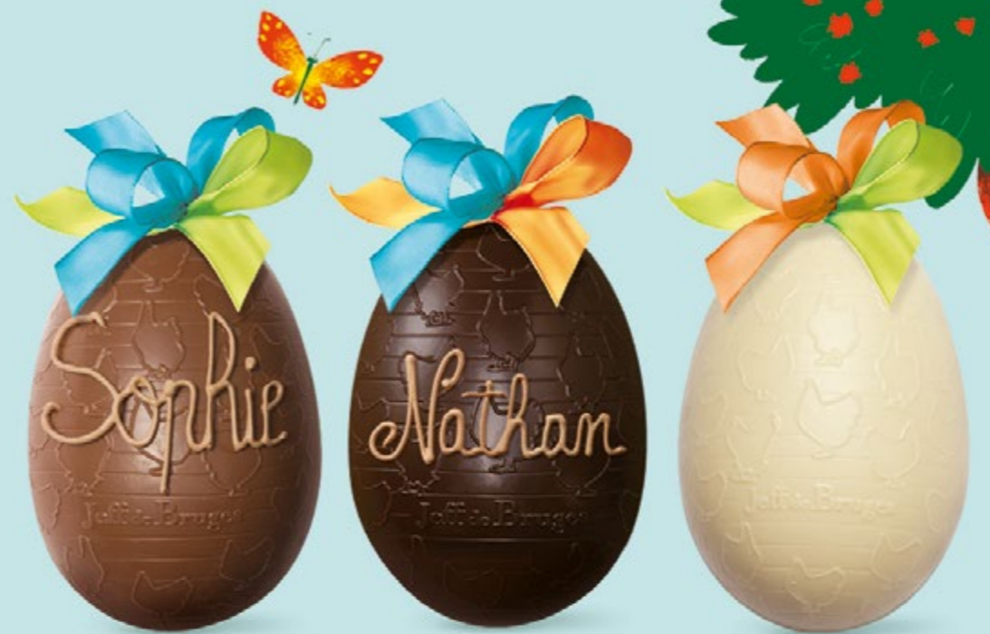
Chocolat au lait