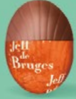
Praliné avec sucre pétillant